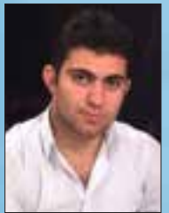
فهراهه پووش زاری

بۆ ئەوێ سهربهرز بژین به (بهلی) دهنگ بۆ سهربهخۆی کوردستان دهدهم