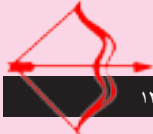
كەۋان ۱۲/۲۱ - ۱۱/۲۳

كىشەكانى رابىردو لە بىر بىكە و رىنگە بە كەسانى دەۋرۋەرت مەدە دەستكارى ژيانت بىكەن، ئەۋ ھەستەى ھەتە بۆ ئەۋ كەسە بىسۋەدە، ناسۇ ناماۋە بە كرانبەدى دەرگايەكى نوچ دەكات، ھەروەسا بارۋۇخىكى خۇشى رۇمانسىت دىتە پىشە چەند چاۋپىكەتتىكى گرنگ تەنجام دەدەيت.