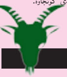
گىسك ۱۲/۲۲ - ۱/۱۹

ھەنگارەكانت بە جوانى جىبەجى دەكەيت، بەلام نەبۇرنى بەخت لەۋ ماۋەبە بىنزارى كەردۋى و زۆرىەى كارەكانت بە نەجامىكى ناساز بۆ دەگەرتەۋە، زۆر ناگادارى خۇت بە و بىرۋاى خۇت بە زۆر مەسەپنە بەسەر كەسانى دىكەدا، ھەروەسا لەۋاى تەندروسىيەۋە خۇشيار بە زىاتر گرنگى بەخۇت بەد.