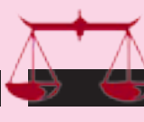
شايدان ۱۰/۲۲ - ۹/۲۳

كەسانىك دۆبەتت دەكەن، بەلام پىلانەكانىيان بەرامبەرت سەرنارگن، بۇيە مەترسە لە جموجولەكانىيان، تەنبا ناگادارى بارى ھەست و سۆزت بە، سەردەى ئەۋ ھەمو كىشەنە لەگەل ئەۋەش شادىت بەردەۋامى دەبىت و مەتەنات بە خۇت بىت.