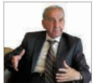
فۇئاد مەھمەد ئەمىن سەراج

ئەوھى لەم پانۆرامايەدا دەبينریت، خستەى ئەو تاوان و كوشتن و برين و لەسیداردان و قەدەغە كەردنى ھاتوچۆ (منع التجول) و پلان و پيلانى دەسلەلاتى فاشىستەكانە كە لە دواى (۹)ى حوزەيرانى سالى ۱۹۶۳ بە شپۆھەكى تۆتاليتارى و عەسكەرتارىتانە پەپرەويان كەرد بە دريژايى ھوكمرانىيان تا گەيشتە بەكارھىنانى چەكى كيميائى و ئەنفال كەردنى گەلى كورد. ئەم رەگەزپەرستانە بەدەر بون لە مرۆقبون، لە ھەموو كەلتورنىكى مرۆفایەتى و دادى كۆمەلایەتى، كە بە ھىچ جۆرىك لە فەرھەنگى سياسى و نىشتمانى و مافە سەرەتايیەكانى مافى مرۆف جىگايان نايستەوہ. ئەم نووسینە زۆبەى تاوانەكان دەنووسیتەوہ، وینەى ئەم ميژوويیە پر لە دىندەبىيە كە مرۆفایەتى شەرمى لیدەكات