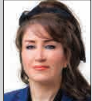
مه ياده محمه د نه چار