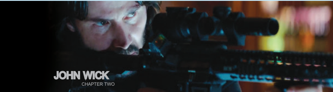
JOHN WICK CHAPTER TWO