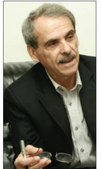
ناسۆ که ریم

تا که ریبه ک له به ر كورد ماوته وه؛ پراکتیزه کردنی رووه که ی دیکه ی مافی چاره ی خۆنوسينه؛ External Self-determination. واته گه لی كوردستان ببیته خاوه ن سه ره ری ته واوی خوی له راست نه ته وه Na-tion کانی دیکه ی جیهاندا. ئه م رووه ی مافی چاره ی خۆنوسين ده که ویته به ر فه رمانی قانونی نیوده و له تی. ۲. خواست و ئیراده ی خه لکی كوردستانه که له ريفراندۆمه نا په سمیه که ی ۳۰ی کانونی دووه می ۲۰۰۵دا له توای كوردستانی باشووردا، به که رکووک و خانه قی و ناوچه كوردنشینه کانی موسل-یشه وه، ۹۸،۷۶٪ی دهنگده ران، دهنگیان بۆ سه رپه خۆیی دا. له راپرسییه کی سالی رابردوی ناوه ندیکی موخته به ری وهك سه نته ری ناشتی و ته نا هیی مرۆیی سه ر به زانکۆی ئه مریکی له ده وک، ۸۳٪ی ئه و که سانه ی لییان پرسراوه، له گه ل سه رپه خۆیی كوردستاندا بوون. که واته ئیراده ی زۆرینه ی خه لک له گه ل سه رپه خۆیی دایه.