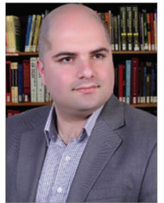
ریياز عوسمان – سلیمانی

له سەرەتای شۆرشى كوردەو بە سەرکردایەتى بارزانى نەمەر هەول و تىكۆشان و خەباتیان بۆ سەربەخۆی كوردستان بوو بۆ بنیادنانى دەولەتى كوردى ئەم خەبات و تىكۆشانە بەردەوام بوو، تەنانەت هەموو شۆرش و رایەپینەكانى دىكەى گەلى كورد هەر لەپیناوى نازادى و سەربەخۆی و سەرفرازى گەلى كوردستان بوو، تا ئەم ساتەى ئىستاش كە سەردەمى شۆرشى نوێیە بە سەرکردایەتى مسعود بارزانى سەرۆكى هەرىمى كوردستان كە بە سیاسەتى ژیرانەو دیپلۆماسیەتى نۆودەولەتى نىكبوونەو هەمان لە سەربەخۆی لەبرینى رىنگایەكى دوورو درێژەو گەیشتووینەتە بەردەرگای سەربەخۆی و ڕاگەیاندى دەولەتى كوردى. ئەوئەى ئەمەرى كوردستان پىی گەیشتوو، بەرھەمى خەبات و خوێنى پىشمرگە و پۆلەكانى گەل و خەبات و سیاسەت و دیپلۆماسیى جەنابى سەرۆك بارزانى بوو، بۆیە دەبینین ئەم هەموو ولاتە كونسولگەرى خۆیان لە كوردستان و لەهەولێرى پایتەخت كرددووتەووەو چاویان لەسەر پىشكەوتنەكانى پۆزانەى كوردستانە كە سەرەرای سەختی دۆخەكەو پیلانى دوژمنانى كوردو كوردستان، هەر لەگەمارۆى نابوورى و برینى بودجەى خەلكى كوردستان تا تىكدانى نۆمالى كوردو دژایەتیکردنى