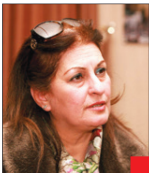
تارا ئەسەدى :

لە ئايىنى مەسىھىدا ژنان لە ئەرك و مافدا شانەشنى پياوان يەكسانن