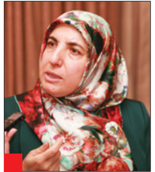
دلخواز عەبدوللا : لەياساى بارى كەسىتى شاھىدى ژن و پىياو وەكو يەكە، كەچى لە ھەندىك دادگاكان تاكو ئىستا ئەم جۇرە ياسايە جىبەجى ناكىرت