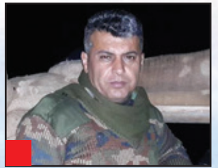
موقەدەم ستار چوچانى : ژنانىك شانەشانى برا پيشمەرگەكان چەكيان كوردەوھە شان و دژ بە دوژمنانى كورد دەجەنگن، ئەوانەش كە لە سەنگەر نين، بە شۆوھىيەكى ناراستەوخۆ لەم پرۆسەيە بەشدارن