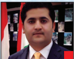
سامان عومه ر:

كۆمه له گه ناتوانی به سه رهیچ كیشه یه کدا زال بیت، یان له بواری کدا سه رکه وتن به ده ست به یینی، ئه گه ره گه زی می له رووی هزری و فیزیکییه وه له گه ل پیاو هاوته ربی نه بیت