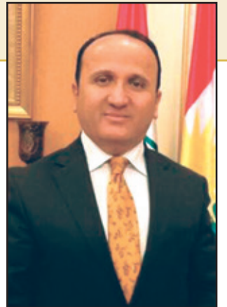
د. عه ره فات که ره م ستونی *