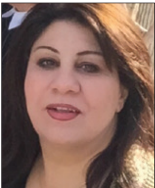
ۋداد ھەمە غەرىب*