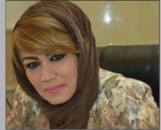
جمبد شوكرى ئاكرههيا*