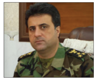
هه لگورد حکمه ت* بۆ گولانی نووسیوه

پشیمه رگه ئه وه هیزه یه که سه نگی سیاسه تی هه رییه کوردستان به رامبه ر به نه یاره کانی له ناوچه که و به تاییه تی عیراقی پر له که لتووری تانیفی و مه زه به ی و پر له کیشه راگرتوووه