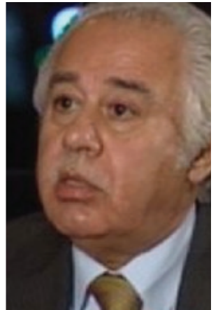
عەبدوئەلھوسەين شەعبان توئۆزەر و بىرمەندى عەرەبى

لەم بۆنەيەدا كۆنگرەي دىالوگى عەرەبى-چىنى-م بىرەكەوتەوئە كە لە سالى ۲۰۱۰ لە پەكىن سازكار، ئەو كاتە لەسەر داواي پەيمانگەي چىنى بۇ توئۆئەنەوئە نېئودەولەتتەيەكان لە چوارچىوئەي دىدارى ھەزرى عەرەبى سەردانى شارە زەبەلاھەكەي چىن (شەنگەھى) مان كرد، لەو كۆنگرەيەدا نوئەرانى ئوردن و يەمەن و مېسەر و ئىمارات و عىراق و كوئىت و فەلەستىنئەش ھەك ئەكادىمىستى فىكرى و رۇشنىبىرى بەشدارىيان كرد، وئىراي چەندىن دىپلۇمات كە لە ولاتانى عەرەبىدا كارىان كردبوو. گەتوگۆكان زياتر لەسەر ئەوئە بوون كە جۆرە ھەزىكە ھەيە بەوئەي كە