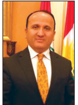
د.عەرەفات كەرەم ستونى*

كورد مافى خۆيەتى ئاگادارى وردەكارىي قۇناخى دواى رزگارکردنى موسل بىت، لۆژىك نىيە كە كورد لەرووى سەربازىيەو بەشدارىي رزگارکردنى ئەو شارە بكات و دواى ئەو پروسەيە لەرووى سىياسى و كارگىرئىيەو پەراوئىزبىخىت، چونكە كورد لە موسلدا دووم نەتەويە دواى عەرەب، ديارە ئەو شارەش دووم گەورە شارى عىراقە و لە عىراقىكى بچوك دەچىت، لەو شارە چەندىن نەتەو ئايىن و ئايىنزاى جۆراوجۆرەيە، بۆيە پىويستە رەچاوى مافى پىنكھاتەكانى بكرىت ھەرودە لە ماددەى ۳ دەستورى ھەمىشەىي عىراقدا ھاتو، رزگارکردنى موسل زۆر پىويستە، چونكە بوونى داعش لەو شارەدا ھەرەشەيەكى مەترسىدارو بەردەوامە بۆ ھەرىمى كوردستان، بەلام من پىموانىيە كە قۇناخى دواى رزگارکردنى موسل زۆر قورس و سەخت دەبىت بۆ كورد لە ھەردوو رووى سىياسى و كارگىرئىيەو، بۆيە پىويستە رىككەوتن و دانوستانى جىددى لەگەل بەغدادا بكرىت دەبارەى قۇناخى دواى رزگارکردنى موسل، ھەرچەندە من لەو باوەردام كە رىكەوتن لەگەل بەغدا لەسەر ھەر پرسىك بىت وەك تۆپرى جالجالۆكە واىە لەھەر ساتىكدا بىت ھەرس دەھنىت، ئەمەش لەبەر ئەو عەقلىيەتەيە كە حوكمى عىراق دەكات، ھەر ئەو عەقلىيەتە بوو عىراقى گەياندە ئەو كاولكارى و گەندەلىيە، بۆيە پىويستە لاىەنى دىكە بەشدارىي لە رىكەوتنەكەدا بكەن بەتايبەتەش سوننەى ئەو پارىزگايە، ھەرودھا دەبى سوننەى ماليكى لەو رىكەوتنە دووربىخىنەو، چونكە ئەوان ھۆكارى پەرتەوازيەى و پارچەپارچەبوونى سووننەن، ھەر ئەوانن رواج بۆ ھاتنى ھەشدى شەعبى و بەشدارىكردنى لە