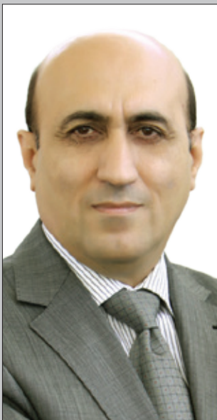
نازا حه‌سب قه‌ره‌داخی

ئێمه‌ی خه‌لكی هه‌رئیمی كوردستانیش وه‌ك ئه‌وان ده‌مانه‌وی هه‌رئیمه‌كه‌مان له عێراق جیایته‌وه و سه‌ربه‌خۆ بێ و ده‌وله‌ت دامه‌زرێنن. ئه‌وان له ولاتانی دیموکراتی خاوه‌ن ئابووری تۆكه‌مه جیاده‌بنه‌وه، به‌لام ئێمه ده‌مانه‌وی له ده‌وله‌تێکی تائیفی فاشیلی پاشكه‌وتووی قه‌رزاز و خاوه‌ن ئابووری داروخاوه‌كه چاره‌مێن ده‌وله‌تی هه‌ره گه‌نده‌له له جیهاندا جیابینه‌وه. ئێمه ده‌مانه‌وی له ده‌وله‌تی ئه‌نفال و كیمیاڕێژ و ته‌عریب و ته‌بعیس و شه‌ری تائیفی جیابینه‌وه. ئه‌وان ده‌یان‌ه‌وی له ده‌وله‌تانی خودان شكۆ و سه‌روه‌ری و ده‌سترۆیشه‌تووی نیۆده‌وله‌تی جیابینه‌وه، به‌لام