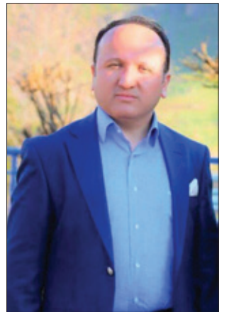
د. عه ره فات كه ره م سستونى*

من ته نيا وهك ره خنه له سه ر كهسايه تىيه سياسىيه كان دهنوسم، چونكه به ده گمهن سياسه تهمه دارى پاك و راستگۆ ده بىنىت، له عه قلىيه تى خه لكه كى عىراق و هه ريىمى كوردستان به و شىويه و ئناكراوه كه هه موو سياسه تهمه دارى گه نده له، بهلام ئه مه راست نىيه، بهلخ سياسه تهمه دارى گه نده ل و ناپاك هه يه چ له عىراق يان له كوردستاندا، بهلام نهك هه موو سياسه تهمه دارى گه نده له، كاتى باسى كهسايه تىيه كى وهك بارزانى دهكهم به هه موو دلسۆزى و قهناعه تىكه وه لىي ده دويم، ئه و پياوه زۆر سته مى ده رحه ق كراوه، و ئنه كه ي شىوئىندراوه، بوختانى بۆ هه لبه ستراره، ئه وهى ده رحه ق ئه و گوتراوه هىچ عه قلىكى دروست قبوولې ناكات، ته نانه ت هىچ مرۆفكىكى خاوه ن وىژدانى زىندوو پىي قايىل نايىت، لېره دا ناى رۆلې هه ندى نووسه رى عىراقى و