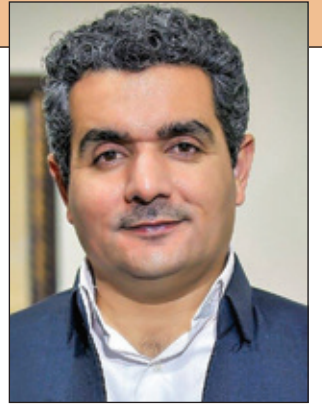
د. فهرسهت سو فی