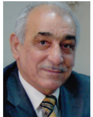
پ. د. فوئاد ھەمە خورشید

دواى ئەوھى ھىزەكانى بەرىتانيا لە سالى ۱۹۱۸ بە ھاوكارىيى شىخ مەحمود ھەفید شارى سلیمانىيان لە چنگ عوسمانىيەكان رزگاركرد، شىخ مەحمود ھەك ھوكمدارى سلیمانى و دەوروبەرى دامەزرا و ميجەر نۆئيلش ھەك راوێژكارى ئەو. مس يىل دەلێت: لە گەل گەيشتتى نۆئيل بۆ سلیمانى بە گەرمىيەوھ پىشوازی لىكرا، ھەر دواى ئەوھى دەستى بەكاركرد چەند فەرمانبەرىكى كوردى لە ناوچەكانى سلیمانى دامەزراند و بەپىيى توانا فەرمانبەرە عەرەب و توركەكانى گواستەوھ و فەرمانبەرانى كوردستانى لە شوئىن ئەوان دانا، ھاوكات سەربازو ئەفسەرانى توركى بۆ بەغدا گواستەوھ، ھەر لە گەل گەيشتتى شى بۆ سلیمانى چەند ھەنگاوىكى خىراى ھەلێنا بە ھۆى برسىتتى دواى شەر، لەوانە ھىنانى خۆراك و تۆوى دانەوئىلە و پىداوىستىيەكانى بازار، ھەرودھا چەند ھەنگاوىكى بەپەلەشى ھاويشت بۆ نۆژەنكردەوھى مزگەوتە گەورەكان