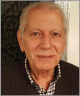
سه ره به ست بامه پرنی