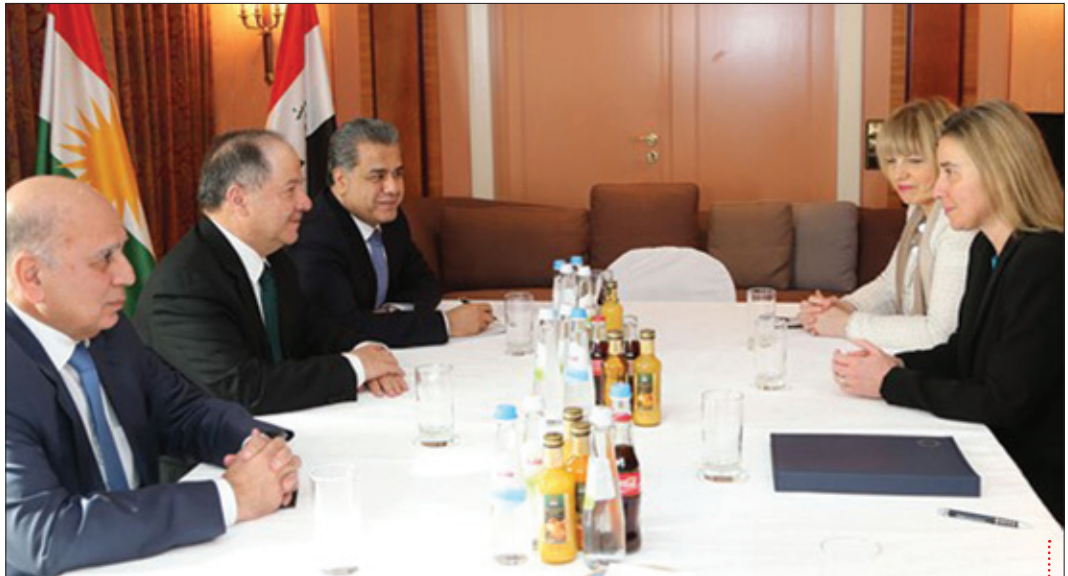
سەرۆك بارزانی له گەڵ به‌رپرسی سیاسه‌تی دهره‌وی یه‌كێتیی نه‌وریا