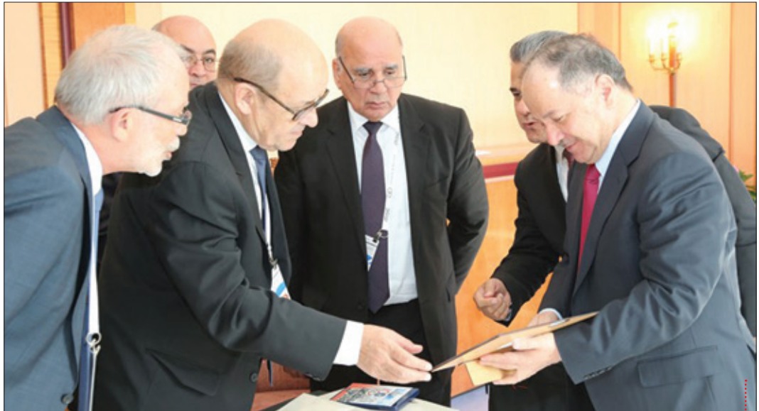
سەرۆك بارزانی له گەڵ وهزیری به‌رگری فه‌رنسا