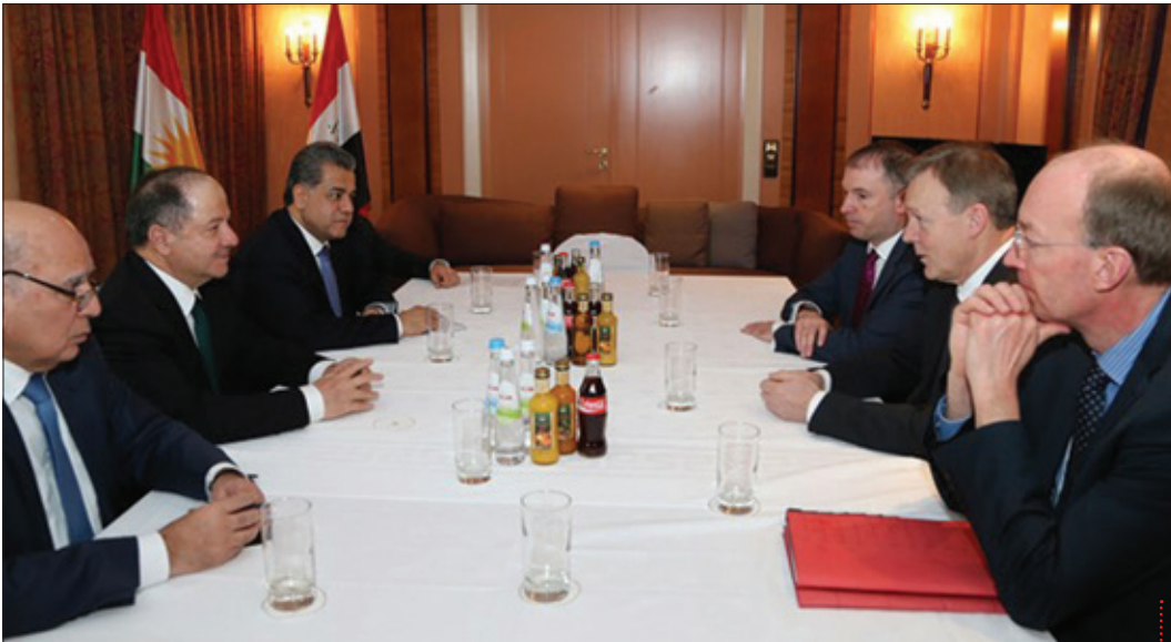
سەرۆك بارزانی لە گەل شاندی پەرلەمەنى ئەلمانيا