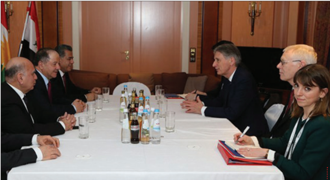
سەرۆك بارزانی لە گەل وەزیری دەرەوی بەریتانیا

بریارى خۆى بدات، ئەویش ناچاره بریارى میلیهتى خۆى جیبه جی بکات، له دواى دهرکهوتنى داعش و راگه یاندى خه لافهتى ئیسلامیش، بارودۆخه که راشکاوانه به هه موو جیهان ده لیت، جارێکی دیکه رۆژه لاتى ناوهراس ت به گشتى و عیراق و سووریا به تاییه تى ناگه پینه وه بۆ پیش دهرکهوتنى داعش و داگیرکردنى موسل و راگه یاندى خه لافهتى ئیسلامى له سووریا و عیراقدا، که واته ئەم وهرچهرخانه پیوستى به خۆ ئاماده کردن هه یه، ئەو نه ته وه و گه لانه ی سهرکرده ی لیها توو و به ئەزمونى وه ک سهرۆک بارزانی میان هه یه، خۆیان بۆ ئەم پیشهاته ئاماده ده کهن، ههر ئەم خۆ ئاماده کردنه شه بۆ پرۆسه ی سهربه خۆی ته وای ناچه زانى کوردستان و دهوله تى کوردستانى کردۆته دوژمنى بارزانی، واته دژایه تى دهوله تى کوردستان له دژایه تى راسته وخۆ و ناراسته وخۆى سهرۆک بارزانی دا کۆکراوته وه.