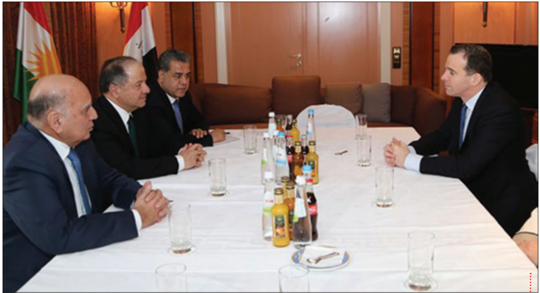
سەرۆك بارزانی له گەڵ ئوتنه‌ری سەرۆك ئۆباما