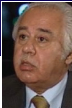
عهبدووحوسین شهعبان تویژهر و بیرمهندی عهرهبی

مسعود بارزانی بهم دواییه داوای له جیهان کردبوو که دان بنین به شکستهینانی ریکهوتتنامهی سایکس پیکو که ههردوو وهزیری بهریتانیا و فرهنسا له سالی ۱۹۱۶ واژویان کردبوو. که ریکهوتتنامهیهکی نهینی بوو بۆ دابهشکردنی ناوچهکانی دهسلات، نهم ریکهوتتنامهیه داوی شۆرشی ئۆکتۆبهری روسیا له سالی ۱۹۱۷ ناسکرا بوو، بارزانی داوای ریکهوتتنیکی تازی کرد که رینگه بۆ دامهزاندنی دهولهتیکو کوردی خۆش بکات. مسعود بارزانی له لیدوانیکیدا که رلاژنامهی گاردبانسی بهریتانی له کۆتایی کانونی دووهمی ۲۰۱۶ بلای کردبوو، رایگهیاندبوو: کۆمهلهگی نێودهولهتی گهیشتوننه ته شو قهناعهتهی که ناکری جارێکی دیکه عیراق و سووریا وهك دوو دهولهتی خاوهن سهروهی ریکبخرننوه، له مەش خرایتر پیکهوتنانی زۆرهملیتی کارێکی ههلێیه، راشکاوانهش ناماژهی بهوه کردوو سهردهمی سایکس پیکو کۆتایی هاتوو.