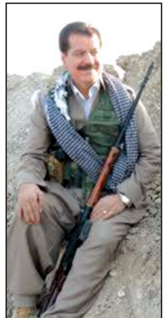
دكتور كه مال كه ركوكى*

شه و جا له دهر هاويشته كانى شه و شوپشانه ي كه پيى ده گوتري «به هارى عه ربه ي»، به تاييه ت له تونس و ميسر و يه مهن-دا، تا ده گاته ته نگرده ي سووريا و تا ماراسؤنى ديپلوماتى شه مريكى و ئيرانى كه سهر شه نجام به ريككه وتنيكى شه تومى له نيوان ئيران و رؤژئاوا گه يشت، پاشان تا گؤرانكار ييه