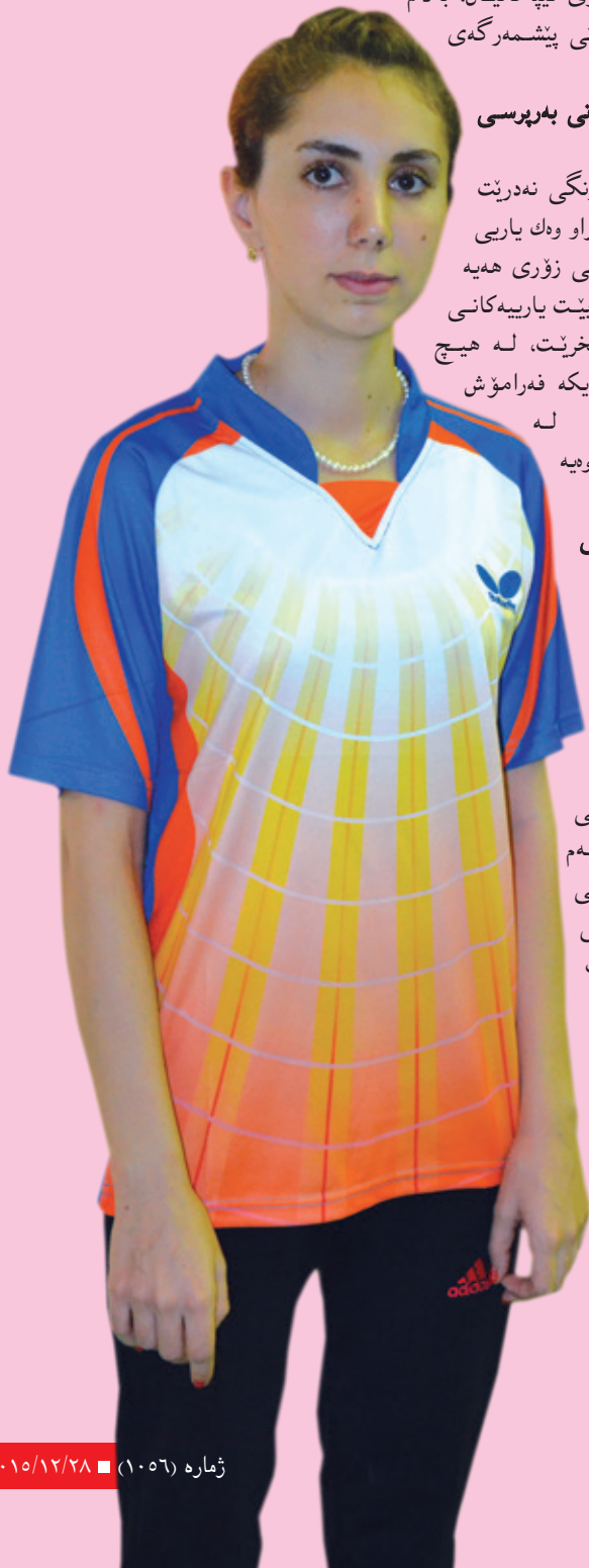
دیسمانہ: کارزان کانہی

- يىگومان ھەلبژاردەي كوردستان بوونى ھەيە و منيش بەكئىكە لە ياريزاننى ھەلبژاردەكە، بە ھىواي ئەوہشم بتوانىن بەشدارىن لە پالەوانتسىيەكى ئىودەولەتى و ئەنجامى شايستە بەدەست بەئىنن بۇ كوردستان.