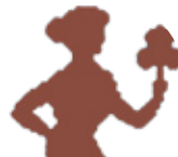
گۆتەگەنم ۸/۲۳ - ۹/۲۲

بێزاریت نایبیت بێتە کۆمپنیک لە بەردەم کارەکانت، ئەگەرچی ماویەکی دلتەنگی، بەلام کانییە و نامینت، مەهیلە نوو دلتەنگیە بە سەر ژبانی تاپەتێت کارێگەری داھات و لیکدانەوتی خراپ بۆ داھاتو مەکە. ژبانی بێر بکەر، و بێر بەر، هەوسەنگی لە ئێزان دلت و عەقلا پێوست، هەر هەنگاوت نا، سەرھا بێر لێ بکەر.