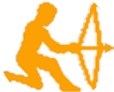
کەوان ۱۱/۲۲ - ۱۲/۲۱

بێر کردنەوت بۆ داھاتو وەرگە توشی بێزاریت بکات، هەولبە ژبانی خۆت رێکخەیت و بێر لە هەنگاوەکانی داھاتووت بکەیتو و بە کێشەکی کەسانی دیکیە کارێگەر مەبە، کە بێزاریت دا لێ پەشیمان مەبەوه، هەندیک هەلسۆکەوت دەکەیت، دەبێت مایە سەراسامووتی دووویەرکەت، زیاتر متمانەت بەخۆت بیت.