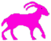
گیسک ۱۲/۲۲ - ۱/۱۹

رەنگە زۆریەکی خەلک بێرسن، ناخۆ بۆ نرخی هەندیک لە نامێرەکانی مۆبایل گرانه و نایستەوه خوارووه، ئەگەرچی لە سەرھادا بە نرخیکی زۆر دەفرۆشریت، کە ئەوەش نرخیکی خاوەن کۆگا و دووکانەکانی فرۆشتنی مۆبایل لە خۆیانەوه دیاری دەکەن، هەر ئەوەشە وایکردووه کە نرخیکی مۆبایل لە شوێنێک بۆ شوێنێکی دیکی جیاوازی هەبێ، بەلام نرخیکی دیاری کرایی خۆی کە بە نرخی دروستکردن و تێچووی نامێرەکییە، شتیکی دیکییە! ئەگەر تازەترین مۆبایل وەرگیرین وەک نمونە، (ئایفون ۶ ئی ئیس)، با بزاین نرخی خۆی لە کارگە و کۆمپانی چەند دەوستیت: شاشە: $۴۲,۵۰، پاتری: $۳,۵۰، کامێراکان: $۱۹، مېمۆری و کارێکەر: $۵۸,۵، بلنډگۆی دەنگ: $۷,۵۰، بەرگی دەروە: $۲۸، بەشەکانی دیکیەش بە جوانکاری و نامادەکردن: $۸۶ واتە نرخی کۆتایی دروستکردنی نامێرێکی مۆبایل دەگاتە (۲۴۵) $ بە هەموو تێچوووەکانی، کەچی لە بازارەکاندا بەم نرخی خەیاڵیانەوه دەفرۆشرین.