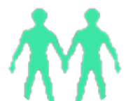
دوووانە ۵/۲۱ - ۶/۲۰

بە هەنگاری کەسانی دیکی کارێگەر مەبە و مەهیلە کارەکانت لێ بشترین و خۆت بە تەنیا بێرکارەکانی ژبانت جێبەجێ بکە، کەسێکی دەبێت دەزایەتیت بکات و چاوکرابووە لە هەنگاوەکانت، دیاریکە لە دوستیکی دێزیت پێدگات، گرتگ نەویە چون مامەلە لەگەل نوو کەسەدا دەکەیت و رێز لە بەکتر دەگرن.