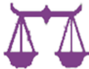
تەرازوو ۹/۲۳ - ۱۰/۲۲

خەریکە کارەکانت لە دەست دەدەیت، بەهۆی ئەوەشە خەریک بووت بە کێشەکی کەسێکی دیکیەوه، داھاتووت بکەیتو و بە کێشەکی کەسانی دیکیە کارێگەر ئارام بە و زیاتر متمانەت بە خۆت هەبێت، هەر کارێک دیکیەیت پێوستی بە بێرکردنەوه هەبە، تا ئەنجامەکی بە دلت بیت و پەشیمان نەبیتووه.