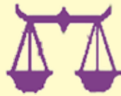
تەرازوو ۹/۲۲ - ۱۰/۲۲

ئەوئەي لە دلئە و لە مېشكەت، بئوستە جىبەجىبان بەكەيت، داھاتوۋت بەندە بە ئىستاۋە، كارىك مەكە لىي بەشىمان بىتەو، ھىچ بەلئىنكە مەدە كە گومانەت ھەيت لە جىبەجىكردى. بەھۆى بارەدۇخى ناچىگىر و نالەبار و ئەو گۇرۇنكارىيانەى لەم ماۋىيەدا روۋدەدەنە روۋبەروۋى كىشەت دەكەنە، بەلام تونائى زۇرت بۇ چارەسەركردنى ھەيە.