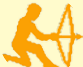
كەوان ۱۱/۲۲ - ۱۲/۲۱

ھەنئەي لە كارەكانت خەرىكە توشى بى ئومىدەت دەكات، بەلام ئايى لە كارەكانت باشگە بىتەو و بەلكو بەرەوام بە، ئەم ماۋىيە بەھۆى سەركەوتەكانت خەرىكە لەخۇبايى دەپت و ئەو كەسانە لەبىر دەكەيت كە ھاركارىيان كۆرۈپت خۇشەبىستەكانت لەبىر بەكەيت، بەلام لە گەل ئەوئەش كارى خۇت فەرامۇش مەكە.