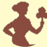
گۆتەگەنم ۸/۲۲ - ۹/۲۲

كىشە و گىرەتەكانت سەخەرە نەستۆى كەسانى دېكەو، ھەمىشە بىر لە داھاتوۋت بەكەو و ژىرانە بېرارد، ئەم ماۋىيە بە كىشەبەك سەرقال دەپت كە رەنگە بېشە ھۆى ئەمەى زۇر لە ھاروى و خۇشەبىستەكانت لەبىر بەكەيت، بەلام لە گەل ئەوئەش كارى خۇت فەرامۇش مەكە.