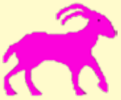
گېسىك ۱۲/۲۲ - ۱/۱۹

ئەوئەي لە دلئە و لە مېشكەت، بئوستە جىبەجىبان بەكەيت، داھاتوۋت بەندە بە ئىستاۋە، كارىك مەكە لىي بەشىمان بىتەو، ھىچ بەلئىنكە مەدە كە گومانەت ھەيت لە جىبەجىكردى. بەھۆى بارەدۇخى ناچىگىر و نالەبار و ئەو گۇرۇنكارىيانەى لەم ماۋىيەدا روۋدەدەنە روۋبەروۋى كىشەت دەكەنە، بەلام تونائى زۇرت بۇ چارەسەركردنى ھەيە.