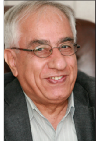
د. شیرزاد نه چارپ