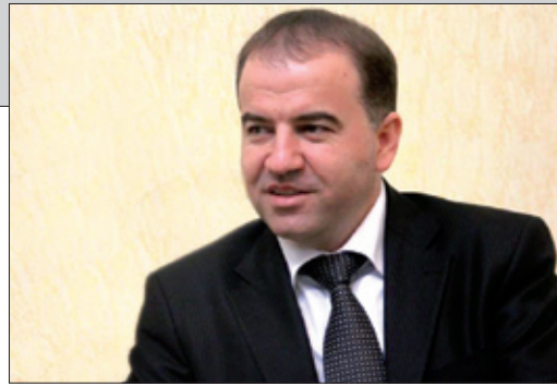
هیمن هه ورامی*

كاتێك بمانه ویت باسی واقیعی ئیستای كوردستان له رۆژهه لاتی ناوهراست بكهین، دیاره پیش هه موو شت دهییت باسی شه پری دژی تیرۆریستانی داعش بكهین، ئه م شه ره شه پریكى درێژخایه نه، دهتوانین بلیین تیرۆریستانی داعش نیشانه ی نه خۆشیه كه ن، نهك خۆی نه خۆشه كه ییت، راشكاوانه تر رێكخراوی تیرۆریستی داعش، به ره مه می دهوله تی فاشیه له رۆژهه لاتی ناوهراستدا، كاتێك تیرۆریستانی داعش له ئایى ۲۰۱۴ هێرشیان كرده سه ر كوردستان، سه رۆكى هه ری می كوردستان ستراتیه تییه تێكى سی ره هه ندى پیا ده كرد كه بریته ی بوو له: