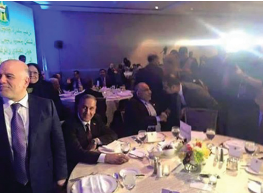
سەرفىردى ۲۵۰ مىليۇن دىنار بۇ خوائىكى بەربانگ

ۋەردە گرن، ئەو بەلگەنامانى دەست لايەنەكانى چاۋدېرى دارايى كەۋتتون لە مەلبەندى ھەۋالگىرى نىشتىمانىيەۋە دەيسەلمىنن كە ئەو لىستە ناۋە لە رىزى داغشان، يان ھاۋكارىانن، كەچى موچەكانىشيان ۋەردە گرن، كۆپى ئەم بەلگەنامانىش دراۋتە نوسىنگەى حەيدەر عەبادى سەرۋكى ئەنجومەنى ۋەزىران.