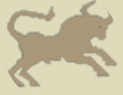
گا ۴/۲۰ - ۵/۲۰

کارەکانت درامەخە و هەرچی باش نینتای بیکە. هەنگاری نینتای گەرفتە بو نامانچەکانی داھاتووت. کاتیک بۆ هەندێ بربارت بە تەمای کەسێکی دیکە دەبیت، رینگە بە هەلە رێنماییت بگات. بۆیە چاکترە خۆت بیریان لێ بکەیتەو و بریاربان لەسەر بدبیت.