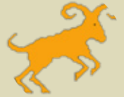
کاوڕ ۲/۲۱ - ۴/۱۹

ماویەک بەو کارەتەرە سەرقال بووت و کاتەکانت کوشت، بۆستە بیری لە باش و خرابی کارەکانت بکەیتەو، چونکە هەموو شتیک بە ئاوات و خواستی تۆ نابیت، لە گەل زبانی رۆژانەدا رینگە بگەو بۆ هەر گۆرانکاری و ئە گەرێک لە زبانی رۆژانەت نامادە بە.