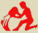
گۆزە ۱/۲۰ - ۲/۱۸

بۆنەبەکانت لە گەل کەسانی نزیکت بەرەو باشە چوو، خۆت لەسەر کەسی دیکە فەرز مەکە و چاوت لە کارەکانت بێت. شێوازی بیری کردنەو بە گۆرە و بە نەجامی کارەکانت رەزامەند بە، چونکە پێشینی شتیک دەگەیت و پاشان را دەرنایت.