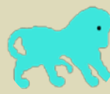
شیر ۷/۲۳ - ۸/۲۲

رۆبەرۆی گەرفتەکانت بێو، بەتایبەت کاتیک بەرەو کارەکانت رینگە دەگری، شێوازی بیری کردنەوت گونجاو تا لە گەل کاری نینتاندای بڕووت، هەمیشە بیری لە داھاتووی خۆت بکەو و مەترسە لە کێشەکانت، چونکە زۆریان نەماو و چارەسەر دەین.