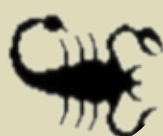
دوویشک ۱۰/۲۳ - ۱۱/۲۱

هەمیشە وابیر بکەو کە ئەوانەي رۆشتن چیدی نایەنەو رینگەت، چونکە بیری کردنەو لە رابردو بە هیچ نەجامیکت ناگەییت. کێشەي خۆت و ئەو کەسە خۆشەویستەت زوو چارەسەر دەبیت، بەلام بۆستی بە هاوکاری تۆیە تا لە گەل بەکتردا رینگەکەو.