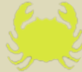
قرۆژان ۶/۲۱ - ۷/۲۲

بیری لە کاروباری خۆت بکەو و ئەوێتە نۆکی لە بیری کردنەت مەکە. ماویەکە گەرفتیک بتراری کردووی و ناتوانی چارەسەری بکەیت، کەسێکی نزیکت نیازی وایە یارمەتیت بدات، تۆش رینگەي نادبیت، ئەوێتە بە خەیاڵ مەچی و بەرنامە بو زبانی داھاتووت دا بێت.