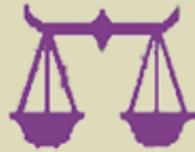
تەرازوو ۹/۲۳ - ۱۰/۲۲

کەسانی دەورەبەرت بیریاری جیاوازیان هەییە، رای هەموویان رەت مەکەو و تەنیا رای خۆت لەلات مەبەست بێت، ئەو کاتانەي هەست بە تەنیاي دەگەیت، بیری لە داھاتوو بکەو، کێشەگەت بچووک و مەجیلە گۆرەتر بێت، گەشین بە لە بیری کردنەو.