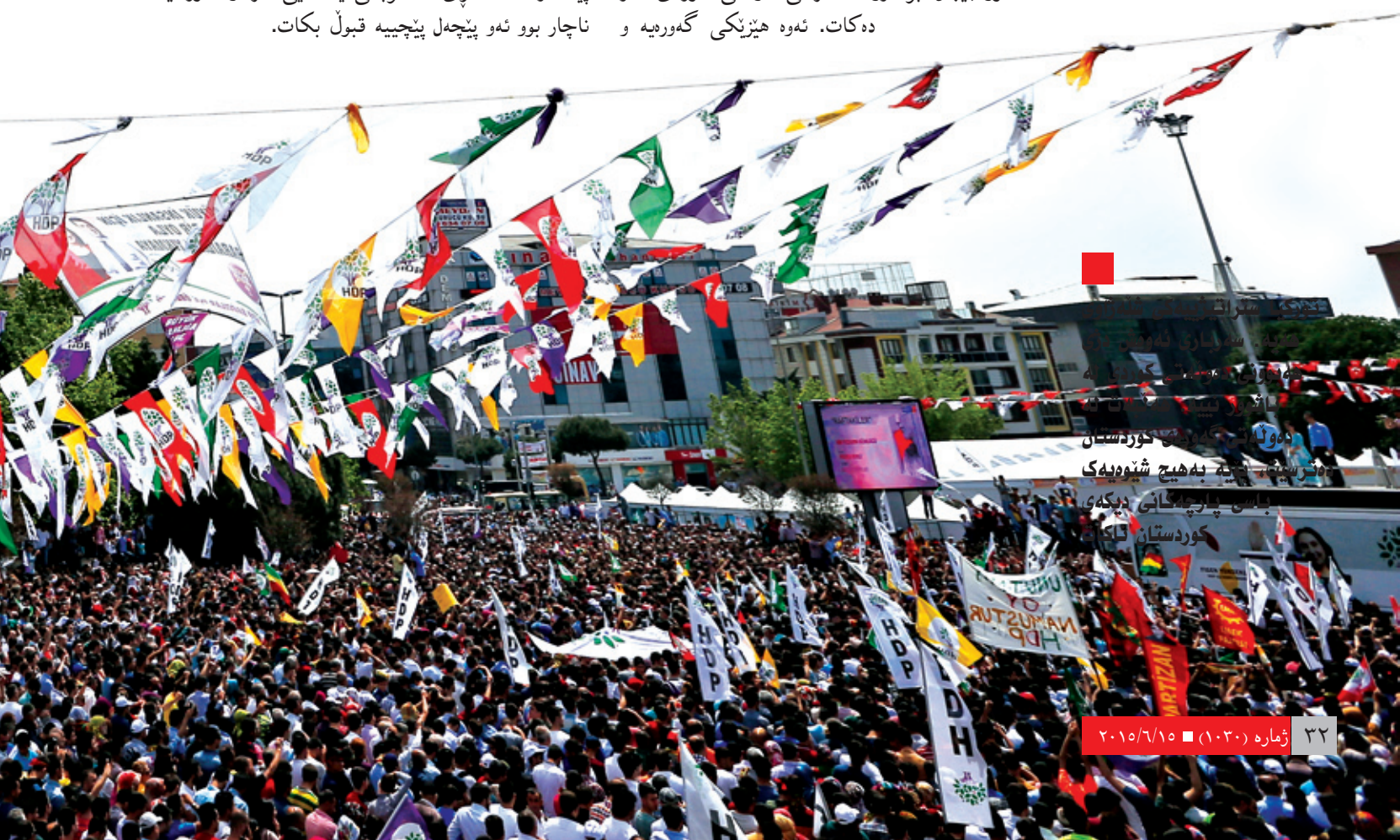
دەولەتتى گەورە كوردستان ھەرىمى بەھىچ شىپەيەك باسى پارچە كانى دىكەي كوردستان ئاك

ئۆردۇغان ئەو دۆخەي ھىنايە كايەو ھە كە رىڭكاي بۇ دروستبوونى ھادەپ و بردنەو مېژوويە كەي رەخساندا، كەواتە پىنويستە كورد لە گۆشە نىڭكاي بەرژەو ھەندىيە كانى خۆيەو، تەماشاي پانۆراماي سىيانزە سائەي ئۆردۇغان بكات. رىڭك ھەك روانگاي شۆرى ئەيلوول بۇ عەبدولكەرىم قاسم