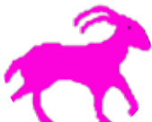
گىسىك ۱۲/۲۲ - ۱/۱۹

- تۆماس جىفەرسيۇن دەربارى دياردە و پرنسسىپەكانى ژيان دەلى : ھەلبەدە ھەردەم لە گەل رېرەۋى دياردەكانى ژيان رېگە بگىرىت، بەلام كاتىك دە گىتە سەر پرنسسىپەكانى ژيان، لە شوئى خۆت وەك گاشە بەردىك بە