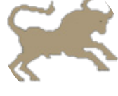
گا ۴/۲۰ - ۵/۲۰

لە گەل بىرۋەكەكانت تا رادىيەك كەسايەتت گونجاندورە، بەلام ناكرى بىر و راي كەسانى دېكە ئەۋمۇش بگەپت، چونكە رەنگە ئەۋان بە ھەلە بىرت لى بگەنەۋە، تاگادارى دەۋرەتت بە و ئەۋمۇندە تۇرە مەبە و خۇراگە بە.