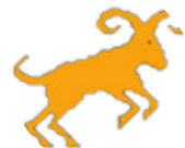
كاۋر ۲/۲۱ - ۴/۱۹

بۇ ماۋىيەكى دورە ھەستت چىگىر نىيە لە گەل كەسكىدا ماۋىيەكە دەمەقالتىنە، نايى بەم جۇرە بىر بگەپتە، چونكە رەنگە ھەلەكە لەلايەن تۇرە بىت، كاتىك دەمۆرت كارىك بگەپت، ئەمۇندە باسى مەكە و يەكسەر نەنجاسى بەد.