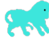
شېر ۷/۲۳ - ۸/۲۲

رېگە داھاتوت چەندىن كار و نەركى تىدا دەپى، بەلام دەپى زىرەكانە كارىن بۇ بگەپت، ھەمىشە دىلخۆش و گەشىن بە، كاتىك بىر لە كارەكانت دەكەپتەۋە وادەئانى كە زۆر ھىلاك و مەندۇرى، ئەمۇندە پەۋىيەنى بە خۆتورە ھەمە ئەۋەك كارەكانت.