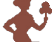
گۈنەگەنم ۸/۲۲ - ۹/۲۲

ھەندى جار بىر لە داھاتوت دەكەپتەۋە و توشى بىج نۇمىدى دەپتە، بەلام پىۋىستە ئەۋە بزانى كە داھاتوت گەشە و چونكە ماۋىيەكى ناخۆشت بەرى كرى، ئىستاش تۇرى ئەۋىيە دىل خۆش بىت، ئەمۇ كارى ئىستانت سەرگەۋتتى بۇ دەپتە.