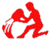
گۆزە ۱/۲۰ - ۲/۱۸

ئىستا كاتى نەۋىيە بىج دەۋدلى بىرەركانت بىدېت و چاۋپى كەسى دېكە نەكەپت، ھىۋاي سەرگەۋتتى ئەمۇ كارى رابردوت زۆرە، بەتايىبەت نەگەر دوۋبارە بىرى لى بگەپتە، زىرانە مامەلە لە گەل كارەكانت بگە و مەتانەت بە خۆت بىت.