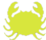
قۇرئان ۶/۲۱ - ۷/۲۲

بىرى رابردو مەكە، چونكە دەپى داھاتوت چىگىر بىكەت و ھەمىشە خۆت بە داھاتو بېستە، ماۋىيەكە بىر و ھەستت چىگىر نىيە، ئەمۇ بەھۇي نەۋىيە زۆر بىر دەكەپتەۋو كارەكانت پشكۆي خستورە، ھەلبەدە لە گەل كەسانى دەۋرەبەت نىزىكر بىت.