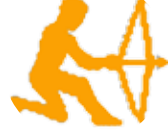
كەۋان ۱۱/۲۲ - ۱۲/۲۱

ماۋىيەكە بىر و ھەستت چىگىر نىيە و شېۋازى رەفتارت تونە، چاكترە نارام بىتەۋە. گەر دەتەۋى بەسەر كىشەكانتا زال بىت، دەپى نارام بگىرىت و رېگەي چارسەرى كىشەكانت بىدۆزىتەۋە، كەسكىكى باشت ناسىۋە و سوۋدى بۇ داھاتوت دەپتە.