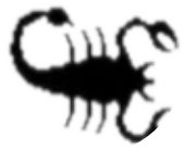
دوۋىشك ۱۰/۲۳ - ۱۱/۲۱

كارەكانت بە جۈاي رېكخستورە و تەنبا ئەمۇ نەپى پەۋىيەبەكانت لە گەل كەسانى نىزىكت لەمۇ ناستە نىيە كە خۆت دەتەۋى، چاكترە لە گەلئان زىياتر نىزىك بىتەۋە و بەلام رېگە مەدە كەس بىتە ناۋ ژيان، ئەمۇ كەسەي ماۋىيەكە لىت نىزىكە مەبەستىكى پاكى ھەمە پۇت.