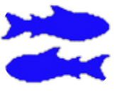
نەھەنگ ۲/۱۹ - ۲/۲۰

ماۋىيەكە ھەست بە دىلئەنگى دەكەپت، بەلام ئەمە شىتېكى كاتىبە و دەۋرات. كاتىك ھەلبەدە كەت كرى، ئەمۇندە بىرى لى مەكە، چونكە داھاتو بە رابردو ناپەستىتەۋە، ھەمىشە چاۋپى بىرۋەكى خۆت بگە و بىر لە داھاتو بگەۋە.