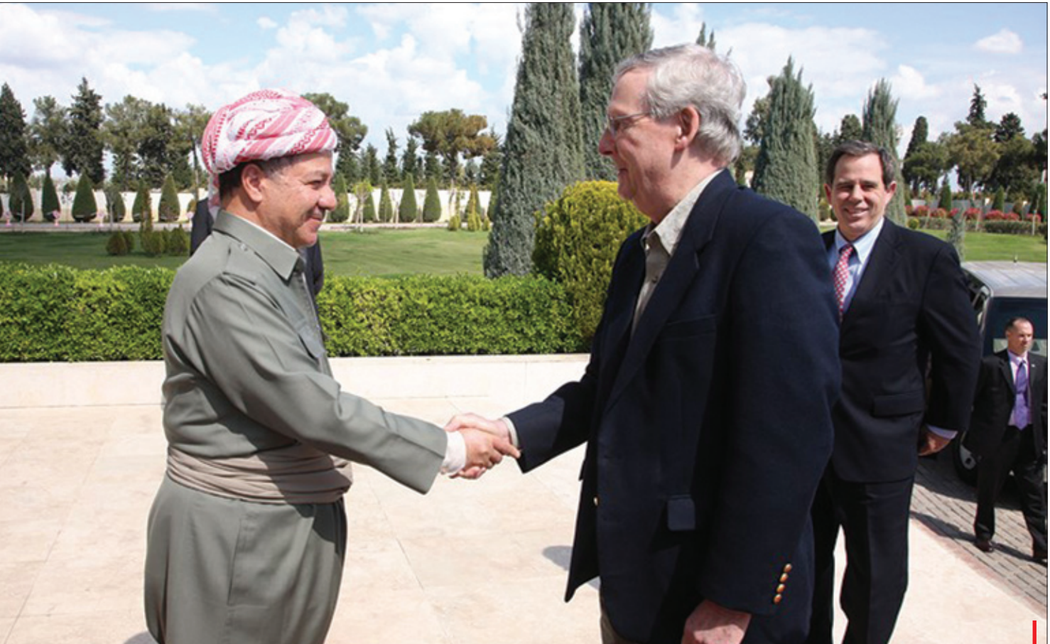
سەرۆك بارزانی له گه‌ڵ شاندىكى بالاي ئه‌نجومهنى پىرانى ئه‌مه‌رىكا

وهك هه‌ر ئايىنىكى دىكه و ناتوانىت خۆى له گه‌ڵ دنىاي مۆدېرن و تايه‌تمه‌ندىيه كانيدا بگونجىنىت. ئىسلام نه ده‌توانىت ديموكراسى قبول بكات، نه عه‌لمانىيه‌ت. من به‌شبه‌حالى خۆم پىموايه ئه‌مه وه‌همىكه له‌سه‌ر ئىسلام دروستكراوه نه‌ك خودى ئىسلام، راي ئىوه له‌و باره‌يه‌وه چىيه؟