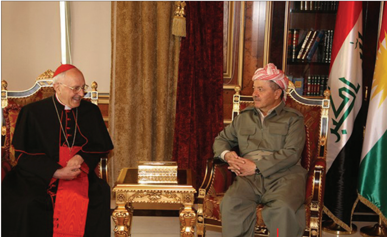
سەرۆك بارزانى لە گەل نوێنەرى قەداسەتى پاپای ڤاتيكان

دەببىن؟ ئۇتۆرىتارىزم، تىرۆرىزم، ديموکراسى، ئىوہ ئەم ولاتانە دەخەنە کوپى ئەم پزیمانەوہ؟ ژان مارکۆ: لە گەل سەرھەلدانى شۆرشەکانى ۲۰۱۱ دا، جىھانى عەرەبى چەندىن گۆرانكارى قوولى بەخۆیەوہ بىنى. ئەو گۆرانكارىيانە بەرھەمى «تەھولە» گەرەکان و لیکدژە بکوژەکانى ئىو خودى کۆمەلگە عەرەبىيەکان بون، کە بەداخوہ پىويست نەبىندران و نەخۆندرانەوہ، تەنانەت لەلايەن ئەوانەشەوہ کە شۆرشەکانيان ئەنجامدا. لێرەوہ، جىھانى عەرەبى رووبەرۆوى کۆمەلگە رووداو بووہوہ کە نەخۆى بۆ نامادە کردبوو، نە زانىشى وەريانگيرپتە سەر گۆرانكارى سياسىيى دريژخايەن و دامەزراو. من پىموايە، بۆ چوونە دەرەوہ لە قەيرانە گەرەکان، ولاتانى خاکی ئىسلام پىويستيان بە گەشەيەکی ئابوورى بەھيژ و سەرلەنوئى دابەشکردنەوہيەکی دادپەرورەنەي سامان بەسەر ھاوولاتیاندا ھەيە. گۆرانكارى سياسىيى و ديموکراسى لە کۆمەلگەيە کدا پرونادات کە لە کۆلانە داخراوہکاندا چەقبيت و ھاوولاتیيەکانى ھيچ ئاسۆيەکی ئوميديان لە بەردەمدا نەيیت و پىيانوا نەيیت کە سەبەينيان لە