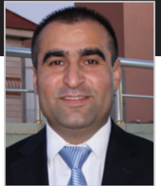
سهر دار شهريف سندي *

نوكه كه فتی یه بواری جیبجی كرن، كو پښكها تی یه ژ ستراتیژی یا ئیرانی بو به شدار بونا راسته و خو یا له شكه ری، سیاسی و دیپلوماسی ل دژی داعش، كو ب دانوستاندنی چرو پرو د گهل رایه دارین دهوله تا ئیرا قی یه. نایبیت د قی بابه تی دا رهوانگه ها پراگماتیکی یا سیاستا دهرفه یا ئیران ژ بیر بکهین.