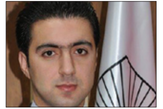
سكرتيري يه كيتي قوتايياني كوردستان: قوتايياني داينه مەو و پاريزهري كوردستان