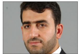
سكرتيري گشتي ريخواوي گه شه پينداني قوتايياني كوردستان: