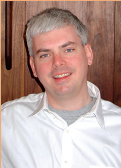
پروفیسور هنری فاریل له زانکوی جورج واشنتون بۆ گولان: