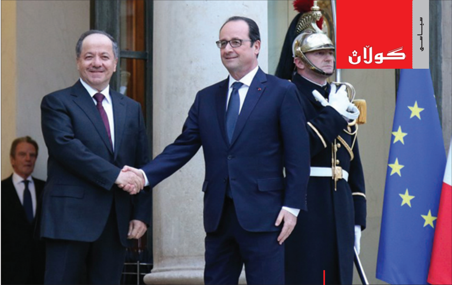
سەرۆك كۆماری فەرنسا پېشوازی له سەرۆكى كوردستان دەكات

بایۆ سایبەر) یان تەکنەلۆژیای نانۆ (نانۆ تەکنەلۆژی؟) ئایا چ کارساتنیک دروست دەیت؟ نامازە کردن بۆ ئەم خالانە بۆ ئەوێ بەزانی بەشی زۆری ئەو تەحەددی و ھەرەشانەى که له ئیستادا رووبەرۆوی جیهان دەبنەو، پەيوەندییەکی راستەوخۆی بە تیرۆر و تیرۆریستانەو ھەبە، بەلام مەترسی ھەموو ئەم بوارانەش لە دوو خالی سەرەکیی شەری دژی تیرۆریستان رەنگی داوتەو، که رۆژناوا لە ھەردووکیاندا نە پێشینی پێدەکریت، نە دەشتوانیت پێشی پێبگریت، که ئەوانیش تیکشانندی تیرۆریستانە لەسەر زەوی، دوو میان رینگرتنە لە کردەوی تیرۆریستی.