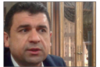
سكرتيري يه كيتي لاواني ديموكراتي كوردستان (بهوكالەت):