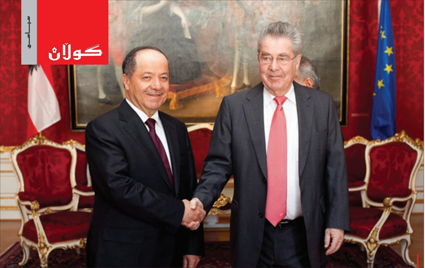
سەرۆکی نەمسا پېشوازی لە سەرۆك بارزانى دەكات

کاراكتەریکی بەهێز، ئەم کاراكتەرە بەهێزە کە خالی یەكەمی پێناسەکردنەوێ، ئاسایشی نیۆدەولەتی و ستراتژیەتی تێکشاندنی تیرۆریستان، ئەو خالە تێدەپەرێتت دروستکردنی دەولەتی کوردستان مەترسی ییت بۆ ئاسایشی جیهان، یان نە، بەپێچەوانەو بە ئیستای جیهان دەولەتی کوردستان ھۆکاری سەرەکییە بۆ رزگارکردنی سیستمە لەبەرەك ھەلەشاوھەکی جیهان، ھۆکاری سەرەکییە بۆ پێناسەکردنەوی سەرورەیی دەولەت و دروستکردنی سوپایەك کە توانای کۆکردنەو و دووبارە دابەشکردنەوی ھەبێت، لە ئیستادا ئەم قەناعەتە لە ئەوروپا دەرکەوتووە، ۲۸ دەولەتەكە ئێورویا کە بتوانن بۆ سەرکەوتن لە شەری تیرۆریستانى داعش و دابینکردنی ئاسایش لەناو یەكیتی ئەوروپا، پاس لەسە بەكەن نامادەن قوربانى بە بەشێك لەسەرورەیی دەولەت بەدەن، ئەوا بێرکەنەو و لە پاراستنی سەرورەری و یەكپارچەیی دەولەتانیکى وەك سووریا و عێراق، شتیکی زۆر لاوھەکییە و لەبەر ئەوەی کوردستان وەك ھێزێکی سەرەکی لەناو ھاوپەیمانی دژتیرۆردا سەلماندنی توانای تێکشکاندنی تیرۆریستانى داعشى ھەیە، ھەرھەا ئەنجومەنى ئاسایشی کوردستان سەلماندنی توانای دروستکردنی متمانە و راگرتنی ھاوسەنگی لە ئیوان دابینکردنی ئاسایش و تاییبەتمەندی و ئازادى تاك ھەیە، ھەرھەا سەرۆکی کوردستان توانای پێشبینیکردنی کێشە و تەحەددییەکانى ھەیە و دەشزانیت چۆن بەرنامە بۆ پێش پێگرتنیان دا بنیت، ئەوا بەرژووەندى ئاسایشی ئیستا و ئاینەدى جیهان وادەخوایت، ئەم کیانە بیستە نمونەى ئەو دەولەتەى کە لە سەدەى بیست و یەك دەتوانیت ئازادى پیاویزیت و تیرۆریستان تێکشکینیت.