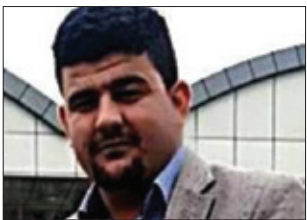
سکریتیری یه‌کیته‌ی گشتی قوتابییانی کوردستان: به‌رزیی ئینته‌مای توێژی گه‌نج ریگره له‌به‌رده‌م ئێستقلالکردنی نازادی ره‌ها بۆ به‌ره‌مه‌یانی هزری توندروه‌ی و وه‌حشیگه‌ری و سه‌رپرین

دیوارێکی پۆلایین له‌به‌رده‌م ریگرتن له‌قه‌تلوعامکردنه‌وه‌ی کورد و ته‌شه‌نه‌کردنی بیرو هزری درناده‌تی و بچ‌به‌زه‌یی و توندروه‌یی، ئیمه‌ وه‌کو توێژیکی قوتابییانی یه‌کگرتووی ئیسلامی کوردستان له‌ماوه‌ی ۲۰ سالی رابردوو کارمان کردووه‌ بۆ پاراستنی ئه‌و هزر و بۆچونه‌ میان‌ه‌وه‌وه‌ له‌دژی بلاوکردنه‌وه‌ی فکری توندروه‌یی که‌ کار بۆ تێکدانی بنه‌ما شه‌رعیه‌ی کانی ئیسلام ده‌کات، چونکه‌ چه‌ندین گروپی توندروه‌ له‌ ده‌روه‌ی سنووره‌کان کاریان بۆ به‌هه‌له‌ تێگه‌یشتنی ده‌ق و نایه‌ته‌کانی ئاینی ئیسلام کردووه‌ و سویدیان له‌ ره‌ه‌ندی سایه‌کۆلۆژی ئاینی گه‌نج وه‌رگرتووه‌، هه‌ر بۆیه‌ شه‌ری داعش به‌ پیشمه‌رگه‌ وه‌له‌ناو بردنی فکری توندروه‌یی ده‌کریت و له‌هه‌ردوو بواره‌که‌شدا گه‌نجان له‌پیشه‌نگی ئه‌و کاره‌دان».