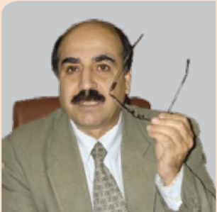
فهريد ئه سه سه ر

به دلنياييه وه ههريمي گه و ره ي سوننه كاريگه ري جيو پوله تيكي گه و ره له سه ر عيراق و ناوچه كه به جی