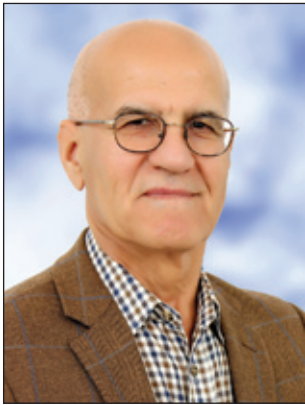
د. له تیف که ریم واحید