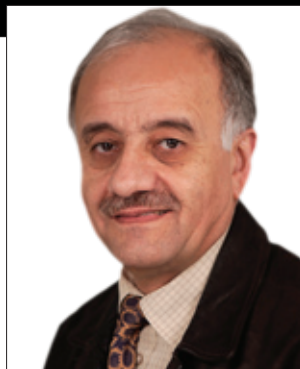
پ. جهمال رهسول محهمه دئه مین*

یه کینک له نهستو نهکان که له دیزه مانهوه کۆمه لگهی کوردستانی له سهه پیکهاتوو به رویوومی کشتوکالی و مالآتدارین. نه مانه تهنه مانای نیسکۆ نۆک و بامی و ته ساته نییه که به سادهی ده کریت کوردستانیان بلین با هه له دراوسیکانمانهوه بۆمان بین و خۆمانیان پیوه سهه رقآل نه کهین. با له بیرمان بیت که چهندهها سال سهه ددام نهیتوانی گورزی کوشنده له بزوتنهوهی رزگاری کوردستانی بدات، ههتا گوندهکانمانی ویزان نه کرد و ده ماری خوینی له ژیانی گوندنشینهکان نه پری و کۆمه لگه کدی له وه به رهینهوه کرد به وه کاریه. کهلتووری کوردستانی بهم تهوه رهوه به ستراوه و پاراستن و گه شه پیدانی له تهستی گشت لایه نهکاندا ده بیت و هه به ریگه بهش ده کریت به سهه مۆتکه کدی هه ژاریدا زال بین.