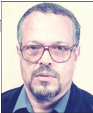
عه‌بدو لسه‌لام بنعه‌بد عالی*

ناسانه له نیو کهسانی هاوچهرخی ئیمه دا هی وا ببینین، که له رهفتارکردنی له گه‌ل «سیسته می گوتار» دا بهم جۆره رهفتار بکات، بهلام بههای رای غه‌زالی لهوهه سه‌رچاوهی گرتوه، که له بنه‌ره‌تا زادهی ژانیکه که جفاکی ئیسلام تییذا ژیاوه. نه‌مه‌ش پالی به بیرمه‌ندانیه‌وه نا به دواي به‌هیزی گوتار و سنوره‌که‌یدا بگه‌رپین، پیوه‌ری لۆژیکیان خسته بن ده‌سه‌لاتی پیوه‌ریکی دی، که نه‌و له نامیز ده‌گریت، به چه‌شنیک له ناستی گوتار و لۆگوسدا ناوه‌ستیت بۆ پوخته‌کردنی نه‌و ریسایانهی که ده‌بیج وابه‌سته‌یان بیت، به‌لکوو به دواي مەرجه‌کانی نه‌گه‌ری گوتندا ده‌گه‌رپیت، هه‌روه‌ها به دواي نه‌و به‌رکارانهی له گوتاره‌وه سه‌رچاوه ده‌گرن.