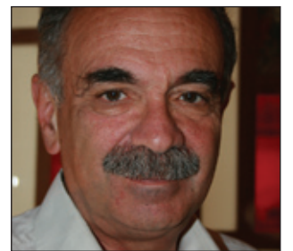
پروفیسور ميشيل فيفورا *

مەودايەكى گەورە دوو جۆر لە تىنگەشتن، دوو جۆر لە بەرھەمەينانى مەعريفە لەسەر رووبەرى گشتى و رووبەرى تايبەتى لەيەك جيادەكاتەووە. تىنگەشتنى ئىمە لە ئىستەو ئىرەدا، لەسەر ئەم ئىشكالىيەتە گەورەيە، ھەمان ئەو تىنگەشتنە نييە كە ٤٠ سالى لەمەوبەر ھەمانبوو. ئىمە دەتوانىن لىرەدا بەخىزايى بگەرپىنەووە سەر ئەلبىرت ئىرشمان و كىتیبە بەناوبانگەكى «Shifting Involvements. Private Inte est and Public Action» وەك نمونە وەرگىرن. لەم كىتیبەدا، ئەلبىرت ئىرشمان دىت و رووبەرى گشتى وەك چوارچىووى كردهك پىناسەدەكات كە ئامانجە سەرەكەيەكى برىتتییە لە بەختەوويى گشتى، برىتتییە لە پابەندبوونى ھاوولائى بە پرسە گشتىيەكانەووە. ھەر وەھا رووبەرى تايبەتى وەك چوارچىووى ژيانى تايبەت و گەران بەدواى بەختەوويى «خود»دا پىناسە دەكات. جياكردنەوى ئەم دوو رووبەرى بەپىنى ئەلبىرت ئىرشمان، چەند مۆركىكى ھەيە. يەكەك لەوانە برىتتییە لە: بىناكردنى لەنىو زەمەنىكى ديارىكراودا. واتە جياكردنەوى رووبەرى گشتى لە رووبەرى تايبەتى، بەپىنى ئەلبىرت ئىرشمان، دەگەرپىنەووە بۇ ساتەوختى گەشەكردنى شۆرشى پىشەسازى لە سەدى ھەفدەھەم و ھەژدەھەمدا. لەسەرەتادا ئەم جياكردنەويە تەنھا پرسى بەشىكى كەم لە