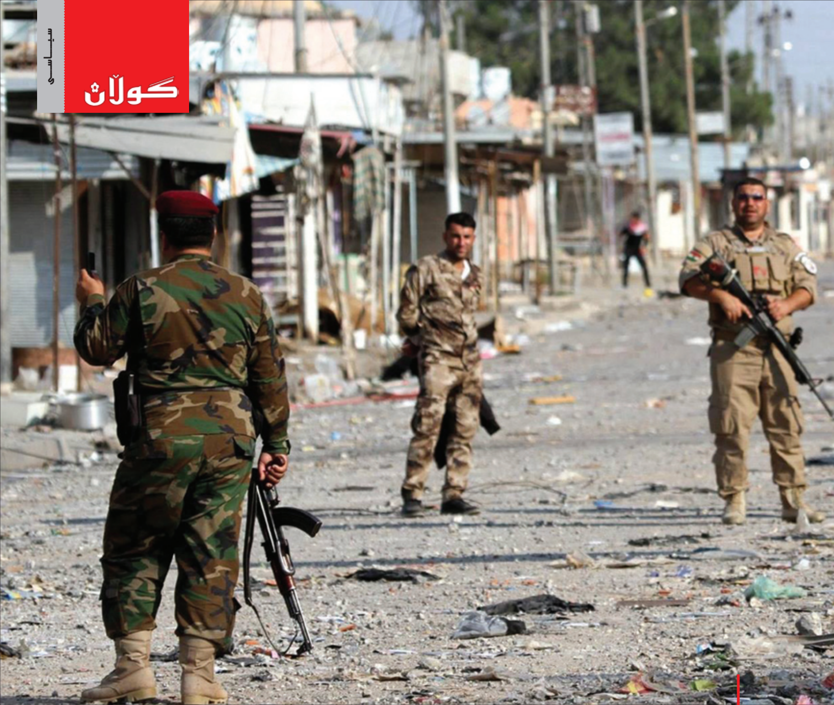
شارۆچکەیی زومار دواى نازادکردنەوی لەلایەن پێشمەرگەو

هواکاری گەورەتری نیوان حکومەتی ئەمریکا و حکومەتی هەرێمی کوردستان، بەلام هیشتا مەسەلەیهک هەیە کە کێشەیه، ئەویش ئەوێه هیشتا هەست ناکرێت هواکارییهکی نزیك له نیوان بەغدا و هەولێردا هەیه. بۆچوونی من ئەوێه شتیکی واقعی نییه کە کوردەکان چاوەڕێی ئەو بکەن کە ئەوان تەنها شەریکی ئەمریکا بن له عێراقدا، کێشەکه زۆر گەورەیه و راسته پێویسته هاوپیماینی له نیوان ئەمریکا و هەرێمی کوردستاندا هەبێت، بەلام پێویست به هاوپیماینی له نیوان ئەمریکا و هەرێمی کوردستان و حکومەتی عێراقیشدا دەکات، له هەر کاتیکی دیکەش زیاتر پێویستمان بهو هاوپیماینییه هەیه. ئەمە خاڵیکه که من شەخسی خۆم دەمەوێت کەش و تێروانییکی باشتر له نیوان سەرجهم لایەنەکانی ئەم گفتوگۆیهدا هەبێت.